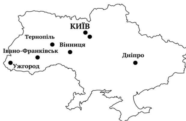
Рис. 3. Територіальне розташування центрів досконалості на карті України

Передбачається, що розвиток центрів досконалості допоможе не лише підвищити рівень знань