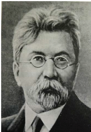
Рис. 1. В. Любинський

Уся їх діяльність спрямовувалась на боротьбу з інфекціями, особливо епідеміями тифу, «іспанки» та холери, зниження малюкової та материнської смертності [3; 6–9]. Першим Міністром народного здоров'я й опікування було призначено відомого українського бактеріолога і фармаколога Всеволода Любинського (1840–1920), який усе життя активно підтримував Павла Скоропадського, був особистим лікарем його родини та брав активну участь у його обранні Гетьманом Української Держави у квітні 1918 року [5].