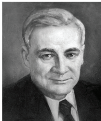
Рис. 5. Професор О. Лазарєв

Він тривалий час очолював кафедру хвороб дітей старшого віку Клінічного інституту для удосконалення лікарів. Вивчав дитячі інфекційні хвороби, розробляв основи раціонального харчування здорових дітей та за хронічних розладів харчування.