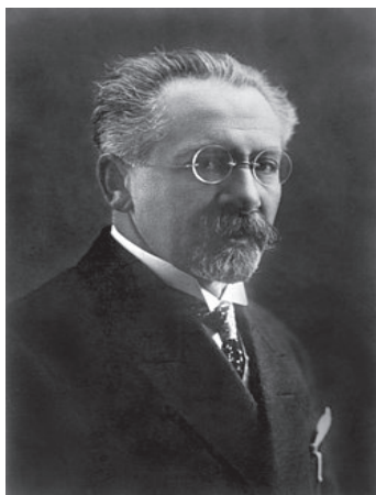
Рис. 4. Професор Є. Скловський

Професор Євген Львович Скловський (1869–1930) організував у Києві першу в Україні консультацію для новонароджених, а згодом перші дитячі ясла, ініціював в Україні громадський рух «Крапля молока» на користь безкоштовного годування дітей з найбільш вразливих верств населення. Саме він у 1918–1920 роках очолював відділ охорони материнства і дитинства Київського Округового Відділу Охорони Здоров'я. Розробляв заходи щодо зниження дитячої смертності на Київщині та в Україні. Розробляв основи догляду за новонародженими дітьми, методи лікування туберкульозу, дифтерії та інших інфекційних хвороб у дітей. Очолював Київське товариство дитячих лікарів. Брав участь у створенні Київської спілки лікарів та організації у 1928 році Інституту охорони материнства та дитинства («ОХМАТДИТ»). Один з ініціаторів створення мережі педіатричних закладів охорони здоров'я [26].