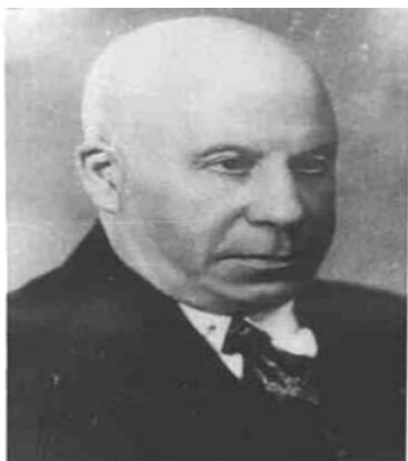
Рис. 6. Професор Л. Фінкельштейн

Так, відомий київський вчений-педіатр, професор Л. Фінкельштейн (1873–1948) (згодом засновник педіатричного факультету КМІ та перший завідувач кафедри госпітальної педіатрії КМІ з 1944 року) працював у ті часи в київському притулку для дітей, яких полишили батьки. Його наукові пошуки, присвячені проблемам розладів харчування, лікування ревматизму, туберкульозу та пневмоній у дітей раннього віку, активно впроваджувались у практичну лікувальну діяльність [19].