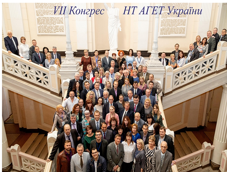
Рис. 3. Делегати VII Національного конгресу НТ АГЕТ України в м. Одеса в 1919 році

обирався наступним президентом. Його перебування на посту президента НТ АГЕТ України охоплює 20 років. IV Національний конгрес НТ АГЕТ України проходив в Алушті у 2006 році, V – у Вінниці у 2010 році, VI – у м. Запоріжжя в 2015 році (рис. 2) [3], VII – у м. Одеса у 2019 році (рис. 3) [4].