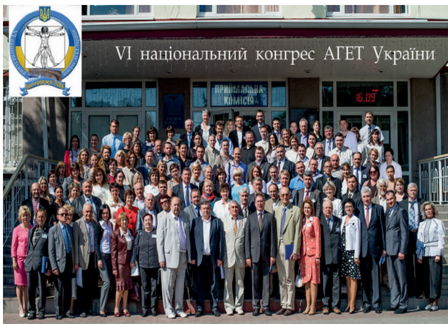
Пам'ятна фотографія учасників VI національного конгресу АГЕТ України.

III Національний конгрес НТ АГЕТ України відбувся в Києві у 2002 році. II президент, професор В. Г. Ковешніков виступив зі звітною доповіддю, охарактеризувавши роботу президії, правління товариства та кожної з морфологічних шкіл України за звітній період. На засіданні правління було прийнято нову редакцію статуту НТ АГЕТ України й обрано III президента, яким став член-кореспондент НАМН України, професор Ю. Б. Чайковський, завідувач кафедри гістології та ембріології НМУ імені О. О. Богомольця. Президентство професора Ю. Б. Чайковського пережило 5 конгресів, на яких він одноостайно