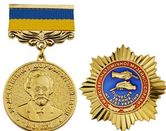
Рис. 4. Нагороди НТ АГЕТ України